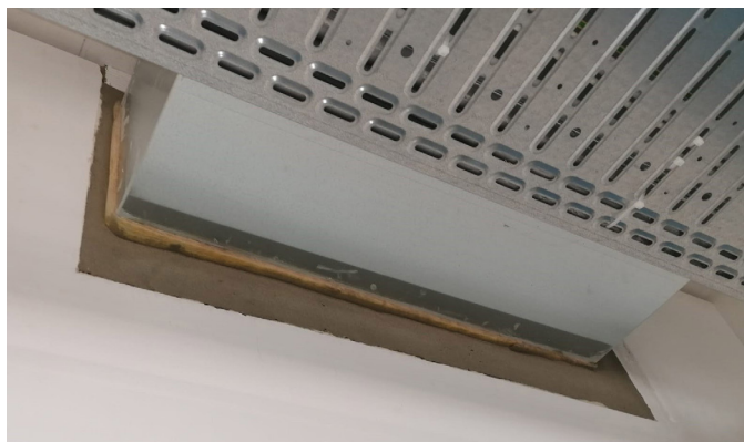
Beispiel eines Lüftungsschachtverschlusses nach VKF-Brandenschutzrichtlinie 25-15, Ziff. 3.7.8.

Von Kindern fernhalten, Kontakt mit Lebensmitteln vermeiden. Augen- und Hautkontakt vermeiden, da das Produkt Zement enthält und alkalisch reagiert. Nach der vollständigen Aushärtung ist das Produkt physiologisch unbedenklich. Achten Sie auf eine persönliche Schutzausrüstung bei der Verarbeitung.